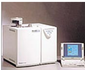
Figura 1. Flash EA 1112 series. Aparelho disponível no Departamento de Química da Universidade Federal de Sergipe (UFS)

Após colocar cada amostra no recipiente adequado para determinação da massa dos elementos citados acima, foi definida uma temperatura de combustão. A partir de então, a amostra sofre combustão e libera gases constituídos pelos elementos C, H, N e S. Esses gases se recombinam com gases mantidos em uma atmosfera específica, produzindo óxidos. Através desses óxidos formados e de sua massa, é possível estimar a massa de cada elemento presente em cada amostra. Como a massa inicial de cada amostra é conhecida, é possível também estimar o percentual dos elementos presentes em cada amostra.