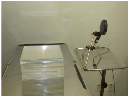
Figura 1. Câmera de ionização posicionada a 0,5 m do objeto simulador de tórax.

As medidas foram feitas por meio de simulação das condições típicas de exames. Portanto, foi utilizado um objeto simulador de tórax construído com material de acrílico de dimensões 30 cm × 30 cm × 15 cm. Este material foi escolhido por ser um dos mais utilizados para simular tecido mole em feixe de radiação ionizante. Para a obtenção das medidas de taxa de kerma no ar, foi utilizada uma câmera de ionização modelo Radcal 10x6-180 e série 08-0135. O objeto simulador de tórax e a câmera de ionização utilizada estão apresentados na Figura 1.